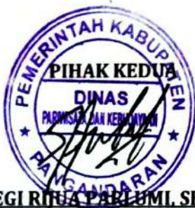
MEGI RIJUA PARLUMI, SE., MM

PIHAK KEDUA akan melakukan supervisi yang diperlukan serta akan melakukan evaluasi terhadap capaian kinerja dari perjanjian ini dan mengambil tindakan yang diperlukan dalam rangka pemberian penghargaan dan sanksi.