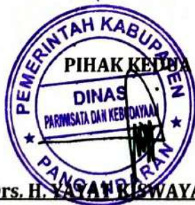
Drs. H. YAYAT KISWAYAT, M. Si

PIHAK KEDUA akan melakukan supervisi yang diperlukan serta akan melakukan evaluasi terhadap capaian kinerja dari perjanjian ini dan mengambil tindakan yang diperlukan dalam rangka pemberian penghargaan dan sanksi.