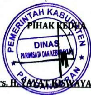
Drs. H. YAYAT KISWAYAT, M. Si

PIHAK KEDUA akan melakukan supervisi yang diperlukan serta akan melakukan evaluasi terhadap capaian kinerja dari perjanjian ini dan mengambil tindakan yang diperlukan dalam rangka pemberian penghargaan dan sanksi.